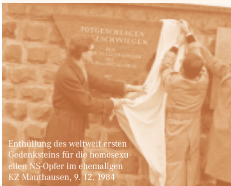
Enthüllung des weltweit ersten Gedenksteins für die homosexuellen NS-Opfer im ehemaligen KZ Mauthausen, 9. 12. 1984

16. bis 22. Juli 1989 ► Durchführung der 11. ILGA-Jahreskonferenz in Wien