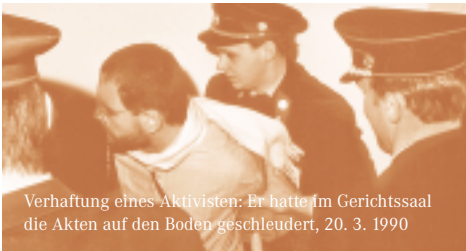
Verhaftung eines Aktivisten: Er hatte im Gerichtssaal die Akten auf den Boden geschleudert, 20. 3. 1990

Wer sagt da noch, dass Politik nicht Spaß macht?