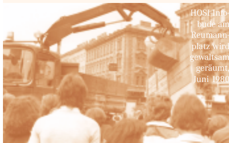
HOSI-Info-bude am Reumannplatz wird gewaltsam geräumt, Juni 1980

Juni 1994 ▶ Teilnahme am Internationalen Marsch auf die Vereinten Nationen bei den Stonewall 25-Feiern in New York