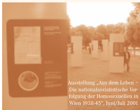
Ausstellung „Aus dem Leben – Die nationalsozialistische Verfolgung der Homosexuellen in Wien 1938-45“, Juni/Juli 2001

16. März 2000 ▶ Galapremiere des Films Der HOSI-Clan