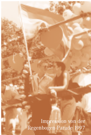
Impression von der Regenbogen-Parade 1997