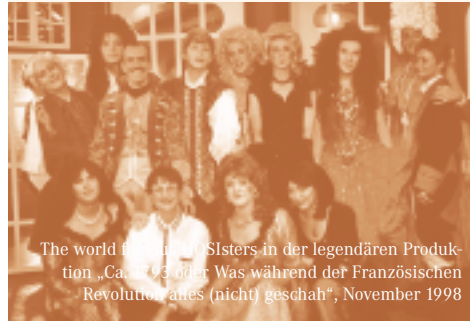
The world famous HOSI Sisters in der legendären Produktion „Carmen 1938“ oder Was während der Französischen Revolution „alles (nicht) geschah“, November 1998

2003 ▶ Die HOSI Wien übernimmt die Organisation der Regenbogen-Parade, 2004 auch des Regenbogen-Balls