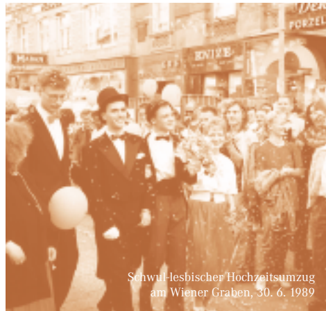
Schwul-lesbischer Hochzeitsumzug am Wiener Graben, 30. 6. 1989