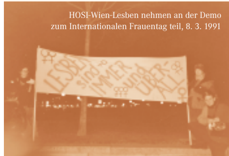
HOSI-Wien-Lesben nehmen an der Demo zum Internationalen Frauentag teil, 8. 3. 1991

1. bis 30. Juni 2001 ▶ Europride 2001 – die HOSI Wien beteiligt sich u. a. mit einem eintägigen EU-Seminar und der Ausstellung „Aus dem Leben“ am größten lesbisch-schwulen und Transgender-Ereignis in Österreichs Geschichte