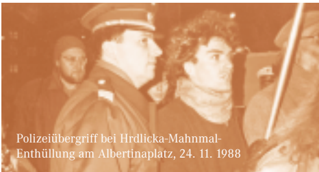
Polizeiübergreif bei Hrdlicka-Mahnmal-Enthüllung am Albertinaplatz, 24. 11. 1988

1. August 1995 ▶ Sturm im Wasserglas: die homosexuellen Neigungen von vier österreichischen Bischöfen werden geoutet