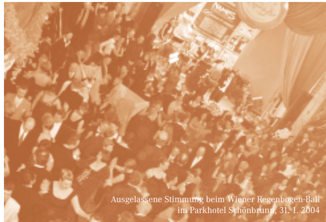
Ausgelassene Stimmung beim Wiener Regenbogen-Ball im Parkhotel Schönbrunn, 31. 1. 2004