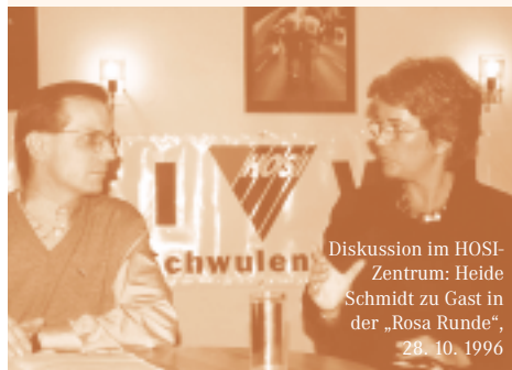
Diskussion im HOSI-Zentrum: Heide Schmidt zu Gast in der „Rosa Runde“, 28. 10. 1996

23. März 1998 ▶ Wiederbelebt Rosa Runde : erstmals „verirrt“ sich ein Regierungsmitglied – Minister Caspar Einem – ins HOSI-Zentrum