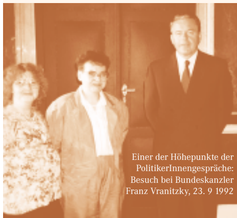
Einer der Höhepunkte der PolitikerInnengespräche: Besuch bei Bundeskanzler Franz Vranitzky, 23. 9. 1992

21. Juni 2002 ▶ Großer Erfolg nach mehr als zwei Jahrzehnten politischer Arbeit: Aufhebung des § 209 durch den Verfassungsgerichtshof