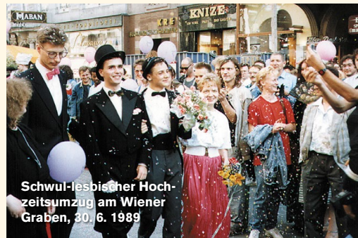
Schwul-lesbischer Hochzeitsumzug am Wiener Graben, 30./6. 1989

In den Tausender-Jahren beteiligt sich die HOSI Wien immer wieder an – teils sehr spontanen – Demonstrationen verschiedener Gruppen gegen die Menschenrechtssituation von Lesben und Schwulen in Osteuropa oder dem Iran, organisiert den Rainbowflash zum International Day against Homophobia and Transphobia (IDAHOT) und ist Teil der aktionistischen Plattform To Russia With Love Austria .