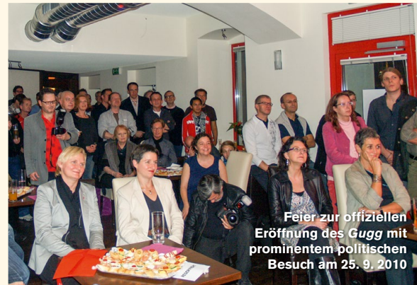
Feier zur offiziellen Eröffnung des Gugg mit prominentem politischen Besuch am 25. 9. 2010

Ins HOSI-Zentrum bzw. ins Gugg kommen die Menschen zum Arbeiten und zum Feiern (auch privater Feste), um sich zu unterhalten und manchmal auch, um sich auszuweinen. Die HOSI – ein Ort des Miteinander .