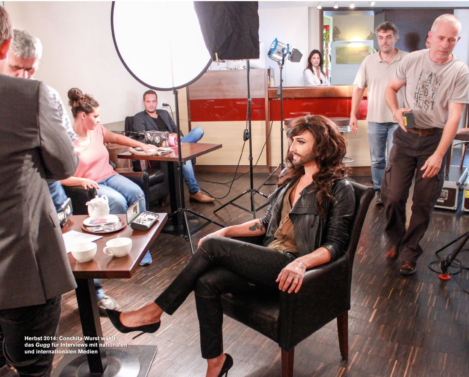
Herbst 2014: Conchita Wurst wählt das Gugg für Interviews mit nationalen und internationalen Medien