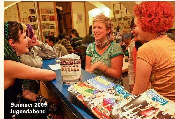
Sommer 2009: Jugendabend