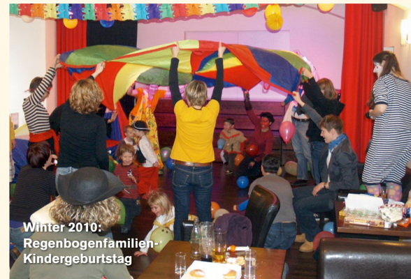
Winter 2010: Regenbogenfamilien- Kindergeburtstag