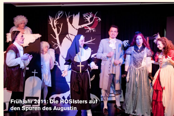
Frühjahr 2011: Die HOSIsters auf den Spuren des Augustin