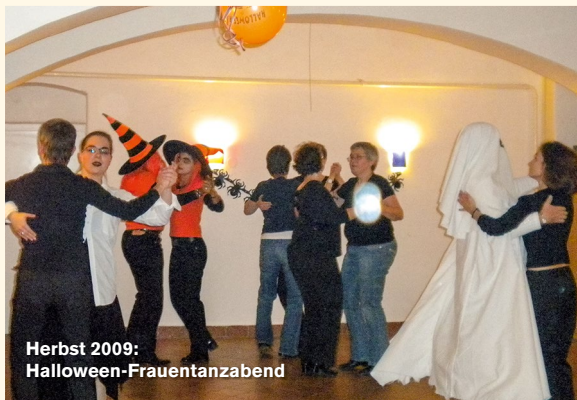
Herbst 2009: Halloween-Frauentanzabend