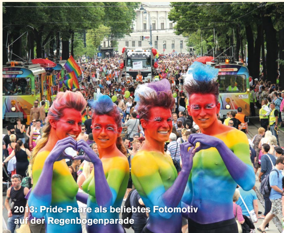
2013: Pride-Paare als beliebtes Fotomotiv auf der Regenbogenparade

Mit der Parade übernimmt die HOSI Wien im folgenden Jahr auch den Regenbogenball, der nicht nur ein beliebter Event für Tanzbegeisterte ist, sondern auch gesellschaftlicher Höhepunkt im lesbisch-schwulen Veranstaltungskalender. Nach anfangs leicht rückläufigen Gästezahlen führt das Organisationsteam den Ball ab den Zehnerjahren zu neuen Besucherrekorden und an die Kapazitätsgrenze des Parkhotels Schönbrunn . 2011 findet der Ball ausnahmsweise in der Wiener Hofburg statt, dem künstlerischen und atmosphärischen Erfolg steht indes ein finanzielles Debakel gegenüber. Die Freude der Stammgäste ist groß, als die Veranstaltung 2012 wieder nach Hietzing in das frisch renovierte Parkhotel zurückkehrt.