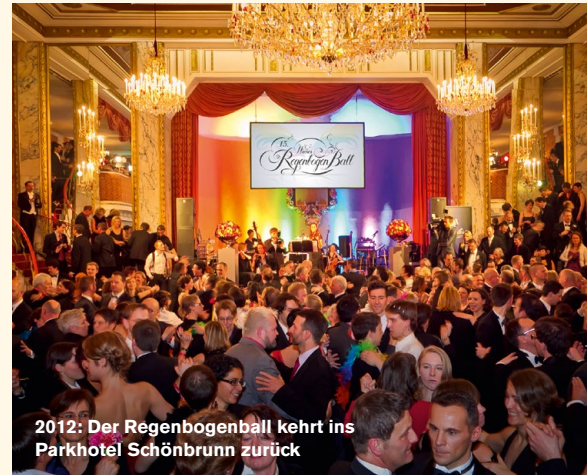
2012: Der Regenbogenball kehrt ins Parkhotel Schönbrunn zurück