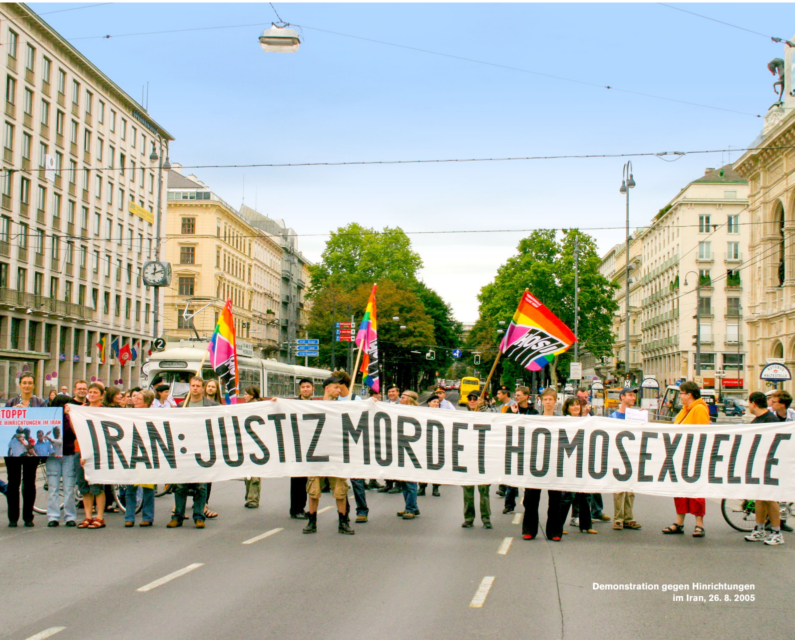
Demonstration gegen Hinrichtungen im Iran, 26. 8. 2005