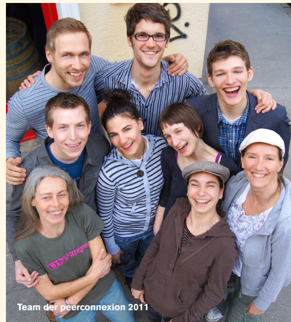
Team der peerconnexi-on 2011

Zu den Aktivitäten, die Politik, Bildung, Kultur und Spaß verbinden, zählen seit Anbeginn die Teilnahme und Organisation von Festen : ob Eröffnungspolnaise am „Rosenball“, Festakte während internationaler Konferenzen („Der Kongress tanzt“) – die HOSI Wien ist immer dabei.