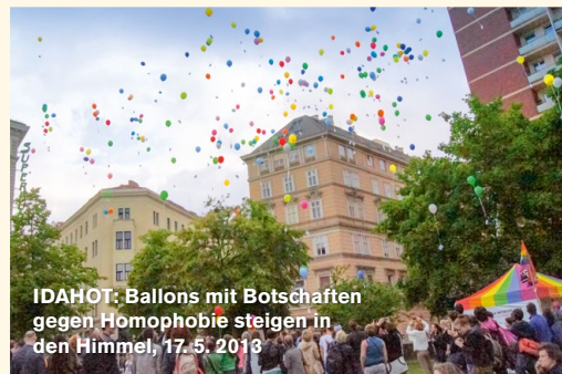
IDAHOT: Ballons mit Botschaften gegen Homophobie steigen in den Himmel, 17. 5. 2013